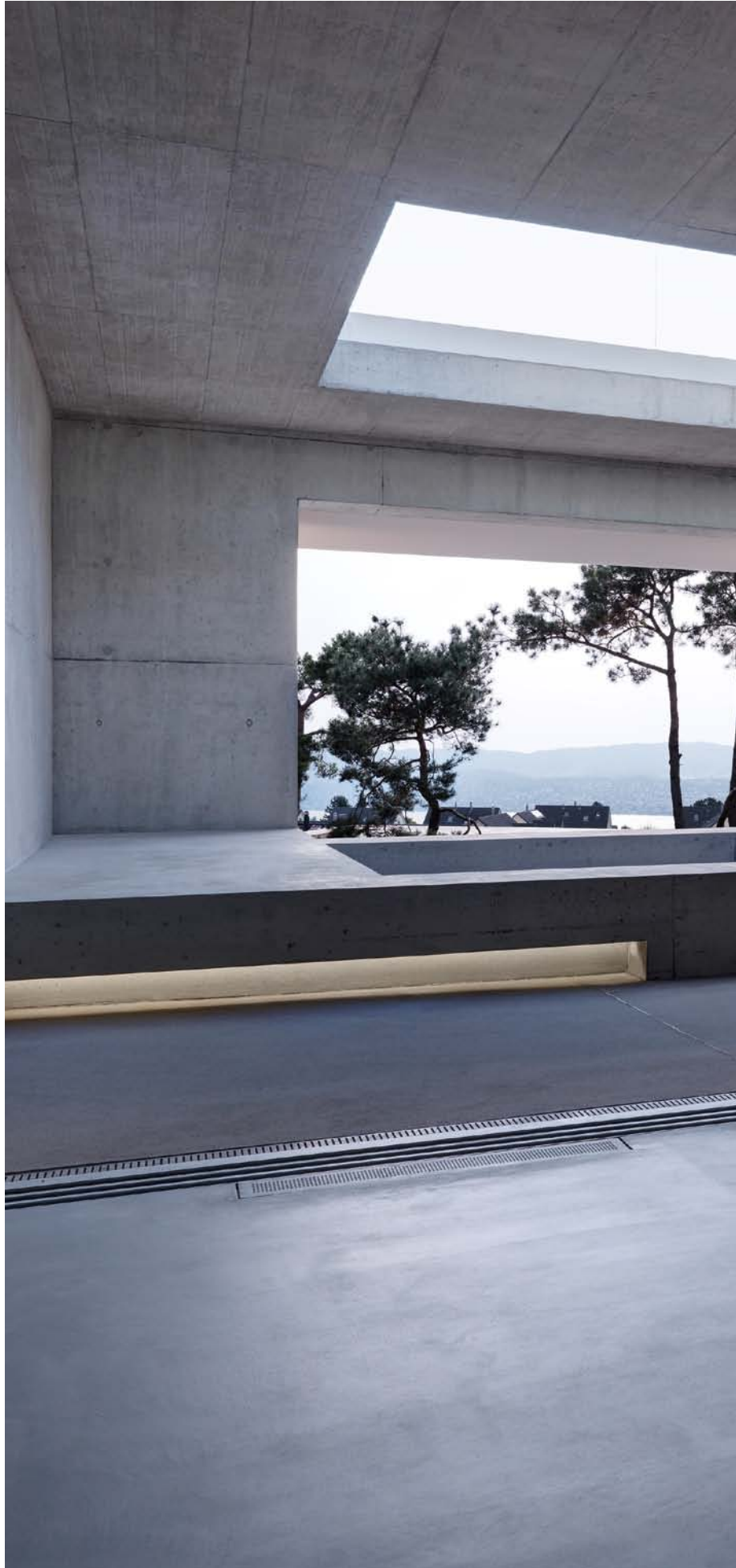
2 verandas, Switzerland. Architecture: Gus Wüstemann, Switzerland, Spain. 2012