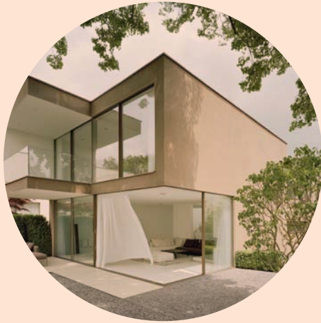
CLASSIC Sliding doors