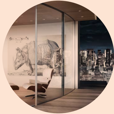
ARC Curved sliding doors