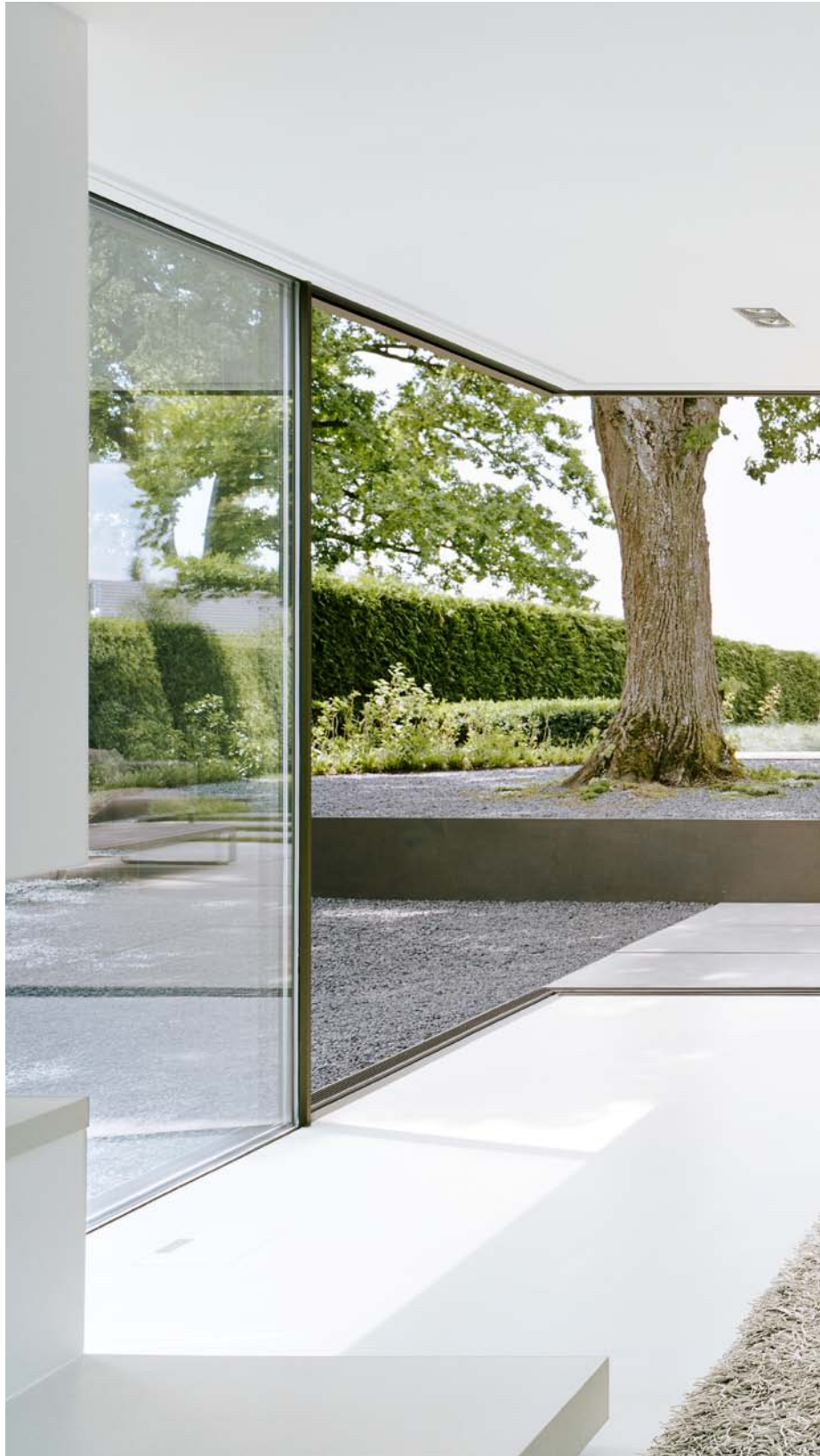
House G, Germany. Architecture: Bembé und Dellinger Architekten, Germany. 2011