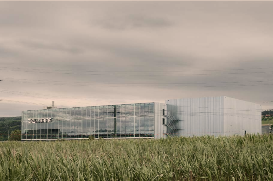
Sky-Frame Headquarters in Frauenfeld, Switzerland.