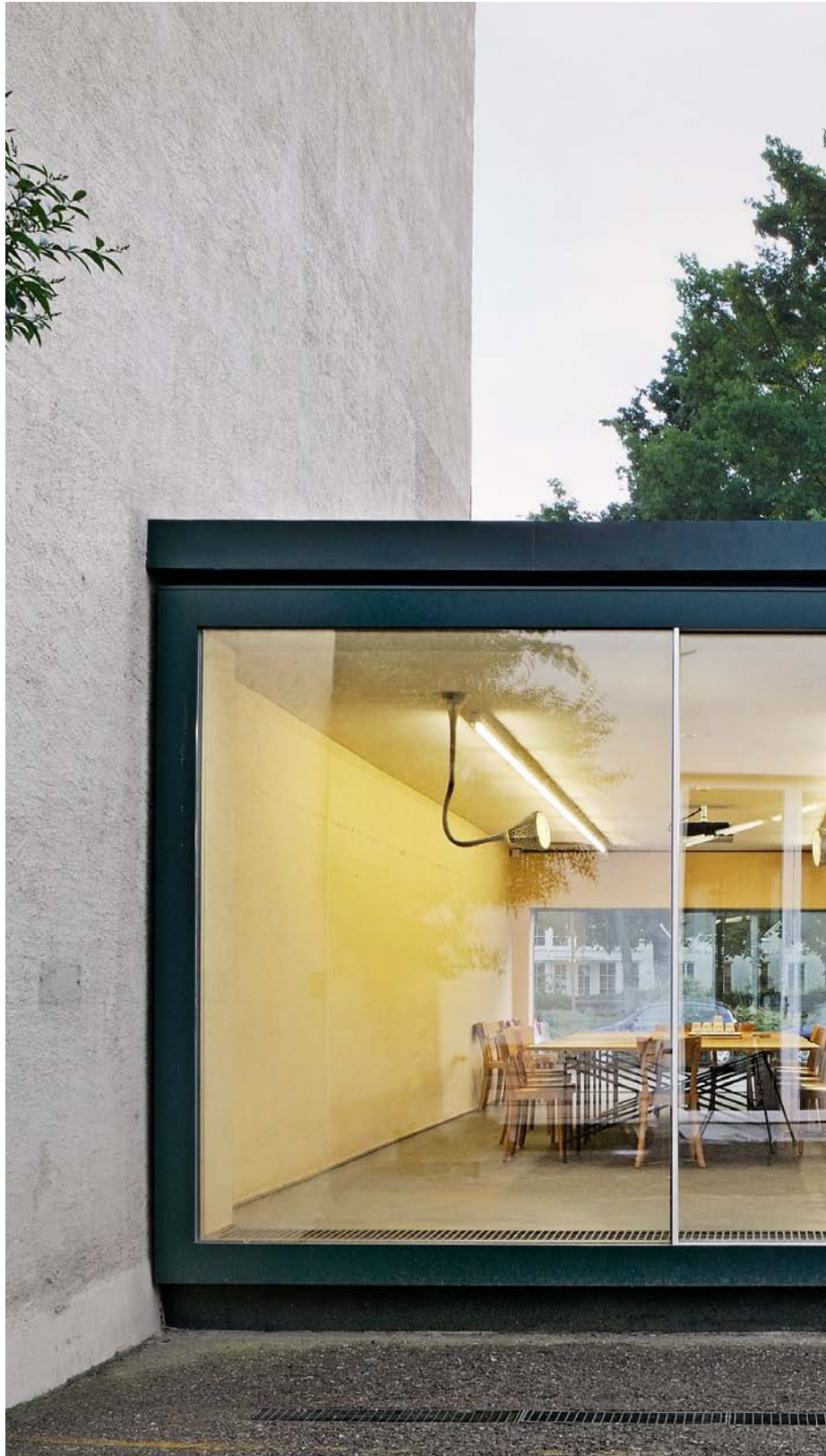
Herzog & De Meuron, Switzerland. Architecture: Herzog & de Meuron, Switzerland. 2008