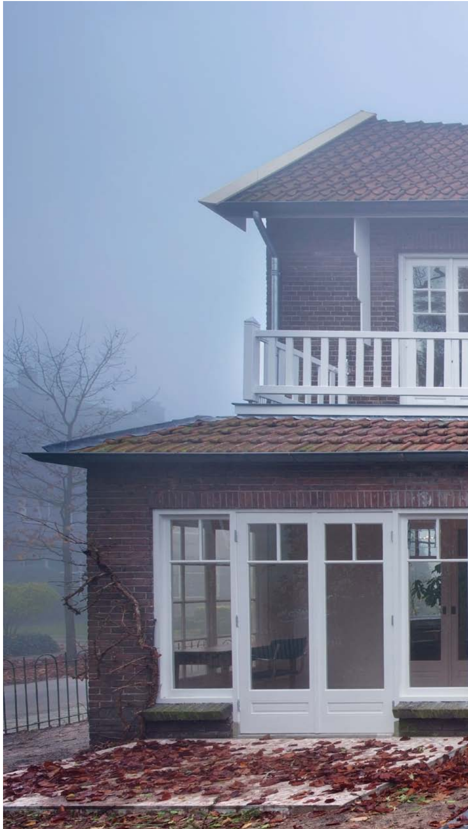
Villa in Utrecht, Netherlands. Architecture: Zecc Architects BV, Netherlands. 2010