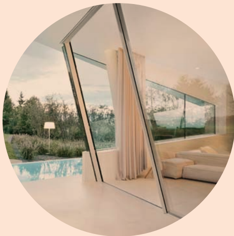
SLOPE Inclined sliding doors