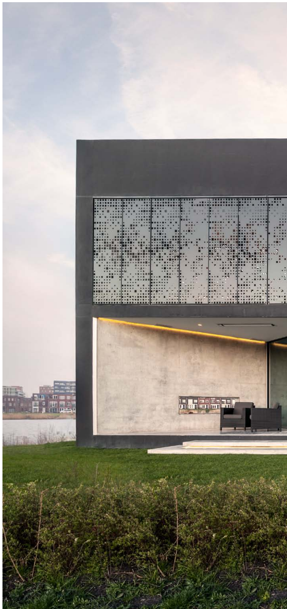
Villa Kavel 01, Netherlands. Architecture: Studioninedots, Netherlands. 2013