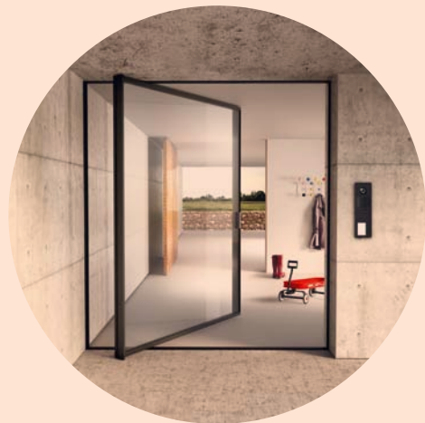
PIVOT Pivot door